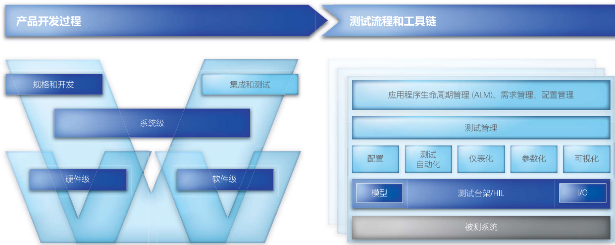
图 2 : dSPACE 评估模型 – 提出提议之前, 我们需要对当前情况详细分析。

人员最后对我们说：“你们真是行家！我们希望你们能全面地向我们提供建议，我们现在要单独联系每家工具制造商才能了解整个流程。”近年来，这类请求越来越频繁，我们现在可以通过提供 dSPACE 过程咨询来满足这些需求。